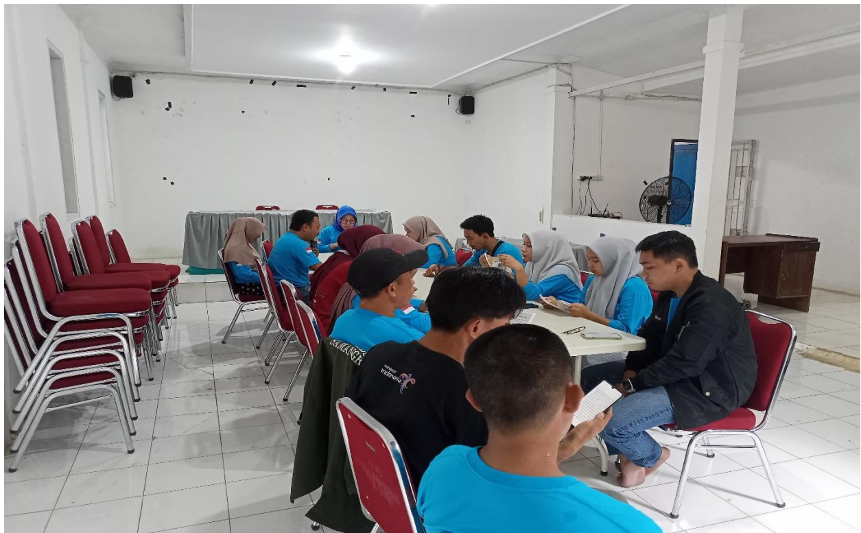
Yasinan Rutin Perangkat